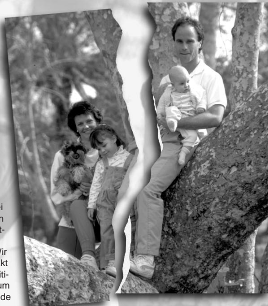
Die „Elterninitiative zur Förderung des Respekts für intakte Familien in der Gesellschaft“ (E.I.F.R.I.G.) kann kontaktiert werden unter: Postfach 76 07 59, 22057 Hamburg. ♦