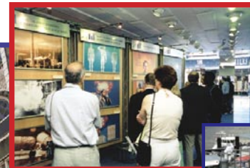
150 Foto-Stellwände vermittelten dem Betrachter einen grundlegenden Überblick über wichtige Aspekte von Scientology.

Diese traurigen Fakten sind das Resultat einer vollkommen gescheiterten Drogen-Politik. Der