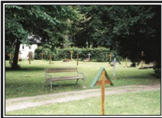
Tödliche Idylle: Für die Vergessenen, die in der Psychiatrie sterben, gibt es anstattseigene Friedhöfe auf dem Gelände.

Die vollständigen Reden der Betroffenen sowie Fotos der Veranstaltung wurden von der Citizens Commission on Human Rights International im Internet unter der Adresse www.psychiatryexposed.org veröffentlicht.