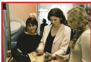
Auf großes Interesse stieß das so genannte E-Meter, ein von Scientology-Geistlichen bei der Seelsorge verwendetes Gerät.

Stellvertretend für viele der Besucher steht die Reaktion eines Funktionärs des Roten Kreuzes, der seinen Sohn durch Drogen verloren hatte. Er sprach seine Anerkennung für die Ausstellung aus und meinte, er würde alles tun, um einzelne Leute oder