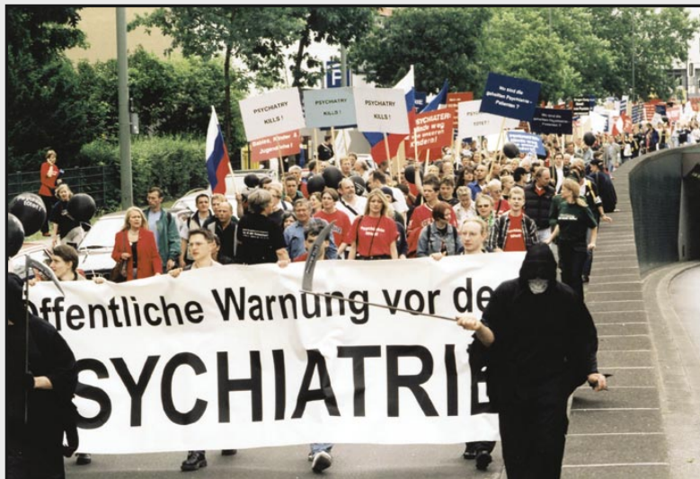
Über 1000 Demonstranten protestierten in Berlin gegen die Weißkittel mit den schwarzen Westen. Die Kommission für Verstöße der Psychiatrie gegen Menschenrechte e.V. (KVPM) informiert seit fast 30 Jahren über die gesellschaftszerstörende Wirkung der Psychiatrie und ihre als Therapie getarnten Foltermethoden.

In diese gefährliche pseudowissenschaftliche Mischung passt auch die umstrittene Person des Präsidenten der biologischen Psy-