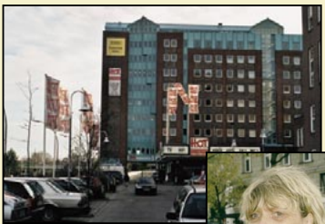
Im 4. Stock dieses Gebäudes geben Ursula Caberta und ihre Mitarbeiter reichlich Steuermittel für grundgesetzwidrige Tätigkeiten aus.

Ende 1993 wird der internationalen Scientology Kirche in den USA sowie weiteren 150 Sciento-