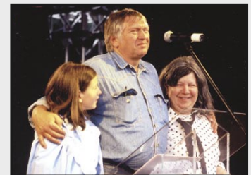
Betroffene und Angehörige schilderten auf der Berliner Anti-Psychiatrie-Veranstaltung ihre Erfahrungen.

Ein ähnlich gelagerter Fall ereignete sich bei der Familie W.: Die damals 7-jährige Tochter wurde ohne Wissen der Eltern und ohne Vorwarnung aus der