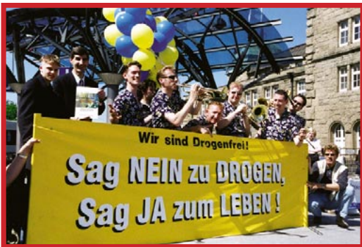
Ein Leben ohne Drogen ist das eindeutig bessere Leben. Mit dieser Botschaft wurden auch im Umfeld der Ausstellung Anti-Drogen-Demos, Konzerte und andere Events abgehalten.

Rund 13 000 Besucher strömten in der zweiten Juni-Hälfte in die neu eröffnete Scientology-Ausstellung an den Alsterarkaden in Hamburg, nur einen Steinwurf vom Rathaus entfernt. Die meisten von ihnen kamen, um mehr über ein Thema zu erfahren, das seit langem in der Diskussion steht, oder auch nur aus reiner Neugier. Die Veranstaltung unter dem Motto „Sag NEIN zu Drogen – Sag JA zum Leben“ vermittelte dem interessierten Betrachter ein umfassendes Bild über Grundzüge der Scientology-Lehre sowie die Ziele und Arbeit der Kirche. Darüber hinaus informierte sie