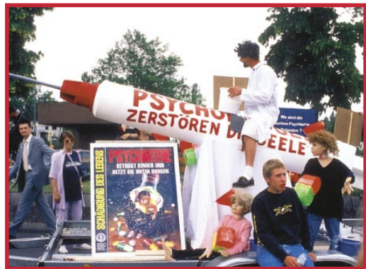
„Psycho-Drogen zerstören die Seele“: Eindringlich weist die KVPM immer wieder darauf hin, dass Kinder und Schüler kein Experimentierfeld für chemische „Lernhilfen“ sind. Die Folgen, vor allem bei Dauerkonsum, sind oft fatal.

den waren. Obwohl die Folgen oft tödlich und stark persönlichkeitszerstörend sind, verschreiben Psychiater solche Drogen an mehr als sechs Millionen amerikanische Schüler. Um sich im Ausbildungssystem einzunisten, hat die Psychiatrie normales kindliches Verhalten wie Zappeln zu psychi-